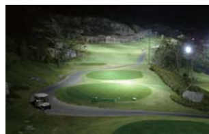
[ 슈퍼 이구아나 카메라 ]