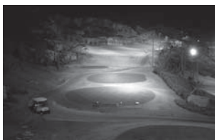
[ 일반 카메라 ]